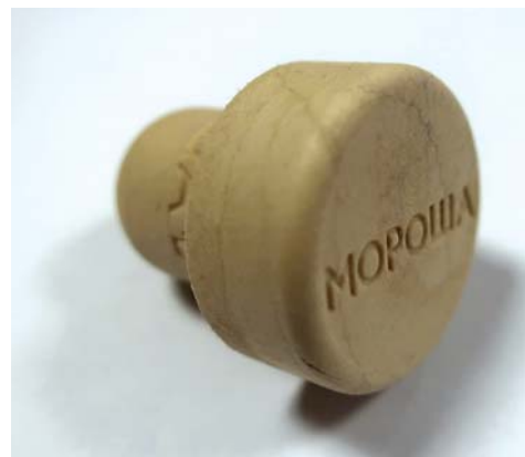
Благодаря Expancel пробки приобретают soft-touch-поверхность и «дорогой» вид

Сотрудники ООО «Лега», безусловно, понимали, что для компаундирования инновационного продукта понадобится оборудование мирового класса. На выставку «Интерпластика-2017» они поехали, поставив себе цель найти поставщика экструзионной установки, которая удовлетворила бы всем требованиям. «Лучшее предложение по исполнению и по цене сделала компания