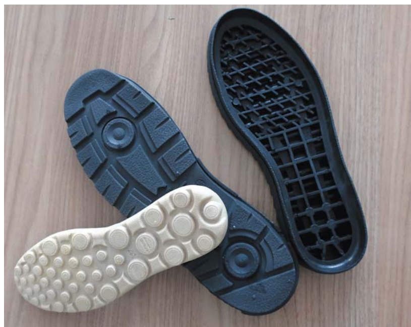
Применение микросфер позволяет существенно экономить при изготовлении подошв обуви

ООО «Лега». — Даже если вы возьмете доступный ПВХ по 100 руб./кг (с НДС) и, казалось бы, недешевый Expancel по 1500 руб./кг, то за счет крайне низкой дозировки и ввиду отличных результатов вспенивания вы сразу почувствуете серьезное удешевление конечного продукта».